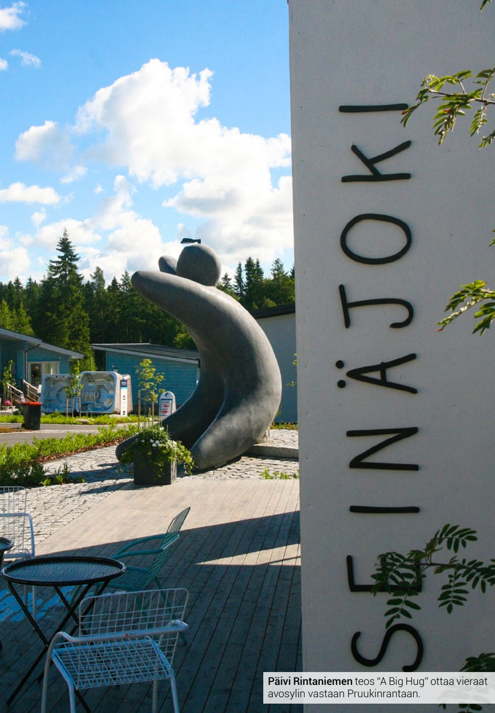
Päivi Rintaniemen teos "A Big Hug" ottaa vieraat avosylin vastaan Pruukinrantaan.

– Halusimme profiloida Seinäjoen uutta asuinalueita taiteen kautta. Tavoitteemme oli taiteen avulla lisätä asuinviihtyvyyttä. Halusimme myös tuoda esille, että taidetta voi hyvin olla myös asuinalueilla, ei pelkästään julkisissa tiloissa tai rakennuksissa. Taitelijoita ja teoksia valitessa meille oli tärkeää, että teokset huomioivat Pruukinrannan alueen luonnon ja historian.