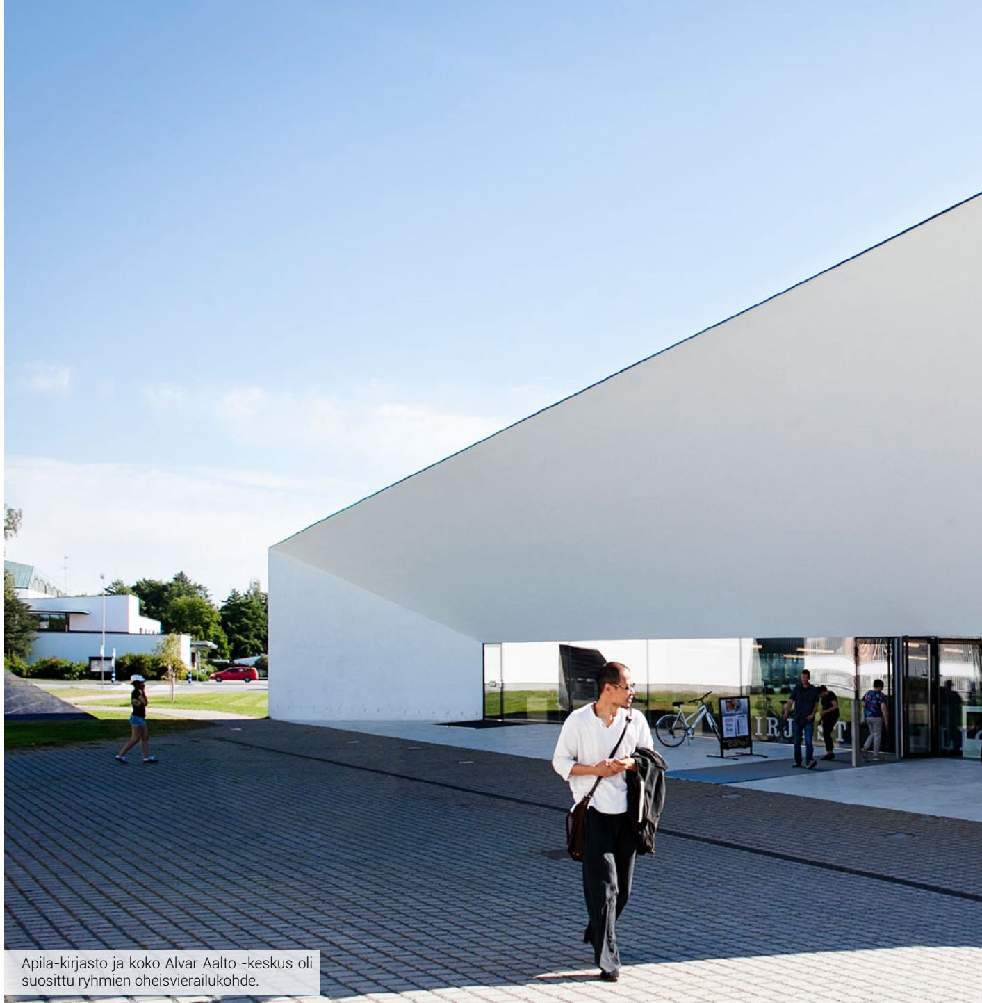
Apila-kirjasto ja koko Alvar Aalto -keskus oli suosittu ryhmien oheisvierailukohde.

Majoitustulo Seinäjoella kasvoi heinäkuussa peräti 35,5 %. Yrittäjiltä saadun palautteen mukaan Seinäjoen hotelleissa näkyi lapsiperheiden puuttuminen, mutta todennäköisesti perheet olivat löytäneet majoitusvaiht- toehdon maakunnan muusta majoitustarjonnasta. Ympäröivien majoituspalveluyrittäjät olivat hyvin tyytyväisiä Asuntomessujen aikaansaamaan kysynnän lisääntymiseen ja liikevaihdon kasvuun.