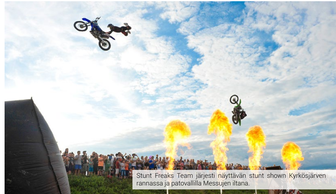
Stunt Freaks Team järjesti näyttävän stunt shown Kyrkösjärven rannassa ja patovalilla Messujen ilta.