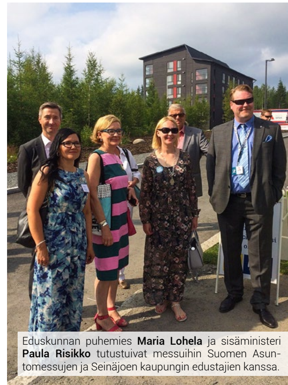
Eduskunnan puhemies Maria Lohela ja sisäministeri Paula Risikko tutustuivat messuihin Suomen Asuntomessujen ja Seinäjoen kaupungin edustajien kanssa.

Messutoimiston ja kaupungintalon sekä Apila-kirjas-